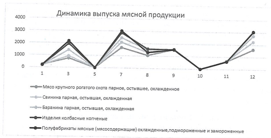
Рисунок 1 - Динамика выпуска мясной продукции

При общей положительной динамике и наращивании производства в 2013-2014 годах произошел спад производства мяса (свинины, баранины, мясо крупного рогатого скота) и увеличился выпуск субпродуктов, колбас (дешевого ценового сектора) и консервов. Это обусловлено тем, что в предыдущие три года Минсельхозом не были субсидированы инвестиционные кредиты, поэтому производство переработанной мясной продукции увеличилось.